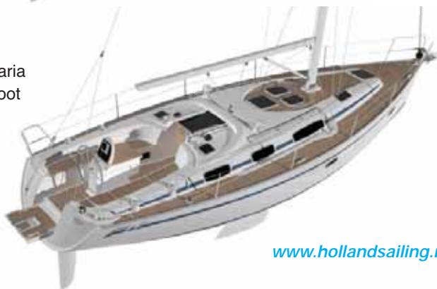
Bavaria 38 foot

Wil je kijken hoe deze boten eruit zien dan verwijzen we je naar de site van Holland Sailing, onze importeur in Nederland.