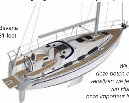
Bavaria 31 foot

Wil je kijken hoe deze boten eruit zien dan verwijzen we je naar de site van Holland Sailing, onze importeur in Nederland.