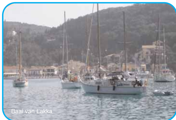
Baai van Lakka

Deze flottielje route is een combinatie van de bovenstaande Korfu- en onderstaande Lefkas-route. Op deze manier zie je naast de bekende plekken ook weer hele mooie nieuwe Griekse dorpjes en prachtige baaien! Dit is een aanrader voor mensen die al vaker bij ons hebben gevaren maar geen afscheid kunnen nemen van het sprankelende Fiskardo of rustige Kastos.