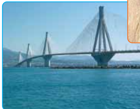
Brug bij Patras